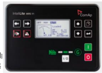
MRS 系列控制器 MRS Series Controller