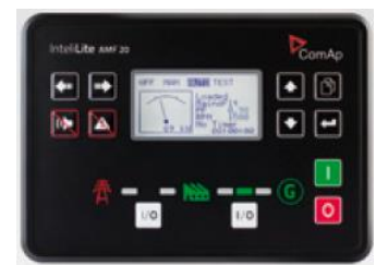
AMF 系列控制器 AMF Series Controller