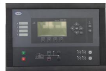
AGC 系列控制器 AGC Series Controller