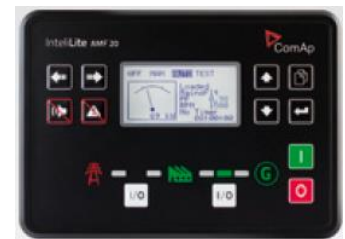
AMF 系列控制器 AMF Series Controller