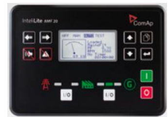
AMF 系列控制器 AMF Series Controller

RS232 and RS485 communication interface are optional. Cloud technology is available for MRS25 module for special requirements. MODBUS communication protocol provided.